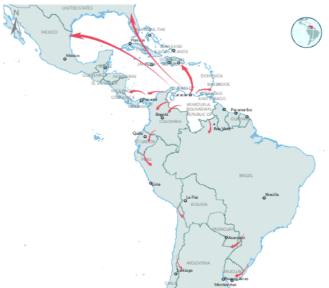
Ilustración 2 – Venezuela: Flujos Migratorios para América Latina